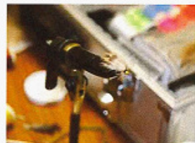
Ett flugbindningsstöd är ett måste för att kunna arbeta på ett bra sätt med flugan.